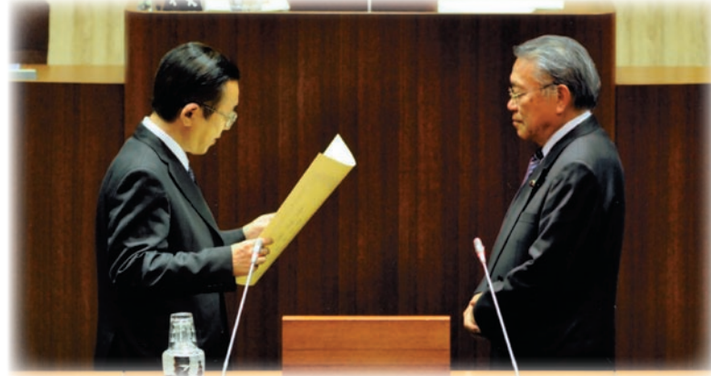
区議会の議決をもって永年在職議員30年表彰を贈呈されました。