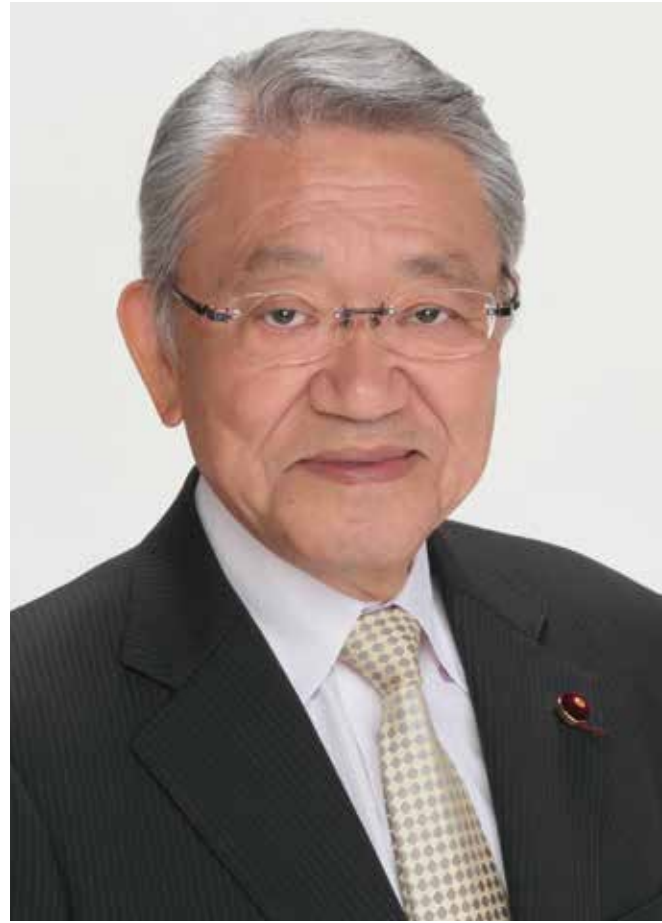
議会運営委員会 委員

親と子どもがともに過ごせる時間は、意外と短いもの。一番大切なことは何かもう一度、考えてみませんか